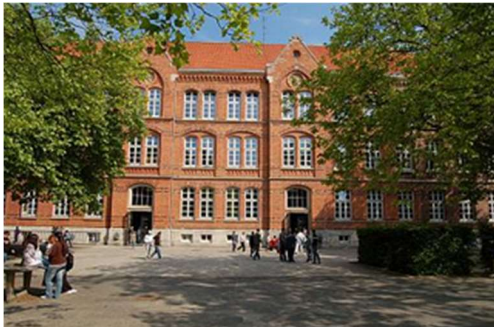
Grund- und Hauptschule Pestalozzistraße