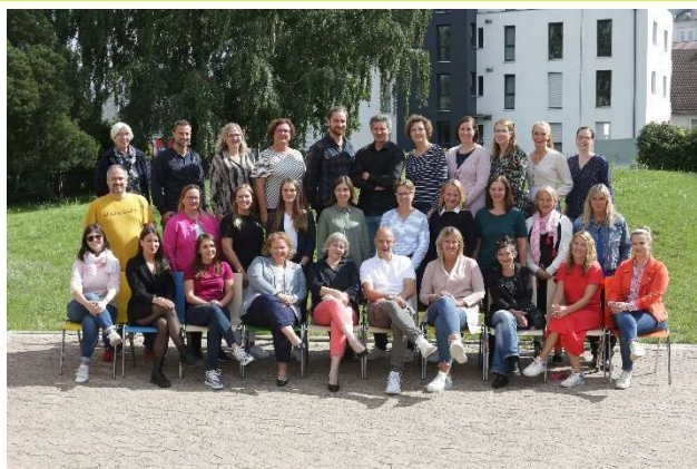
Grund- und Hauptschule Rünigen