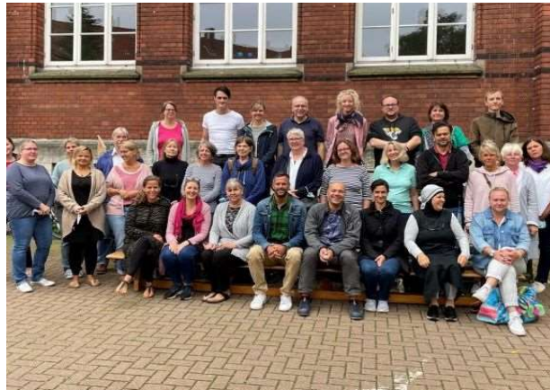
Grund- und Hauptschule Pestalozzistraße

Braunschweiger Hauptschulen stellen sich vor..